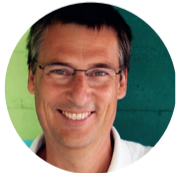
Dieter Ockenfels Regie